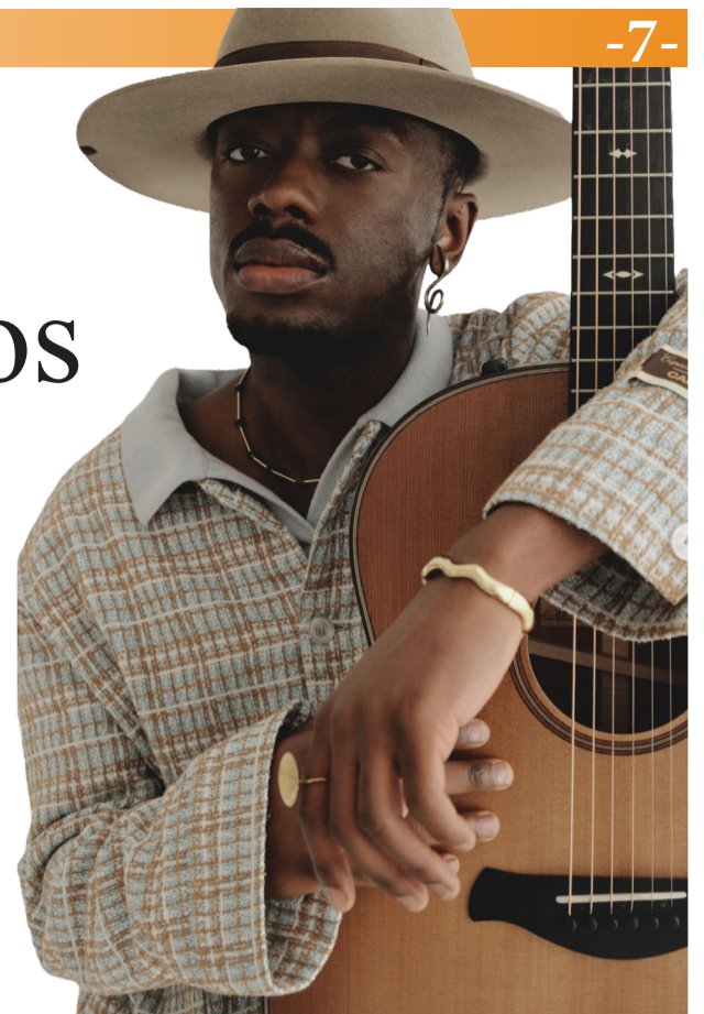
Jota.pê leva nova MPB ao palco da Praça do Povo

Às 21h, o encerramento fica por conta do artista Jota.pê, grande nome da música nacional e da Nova MPB, ganhador de quatro Grammys Latinos. Assim como no dia anterior, haverá circo e área infantil com brinquedos gratuitos para garantir a diversão da criançada.