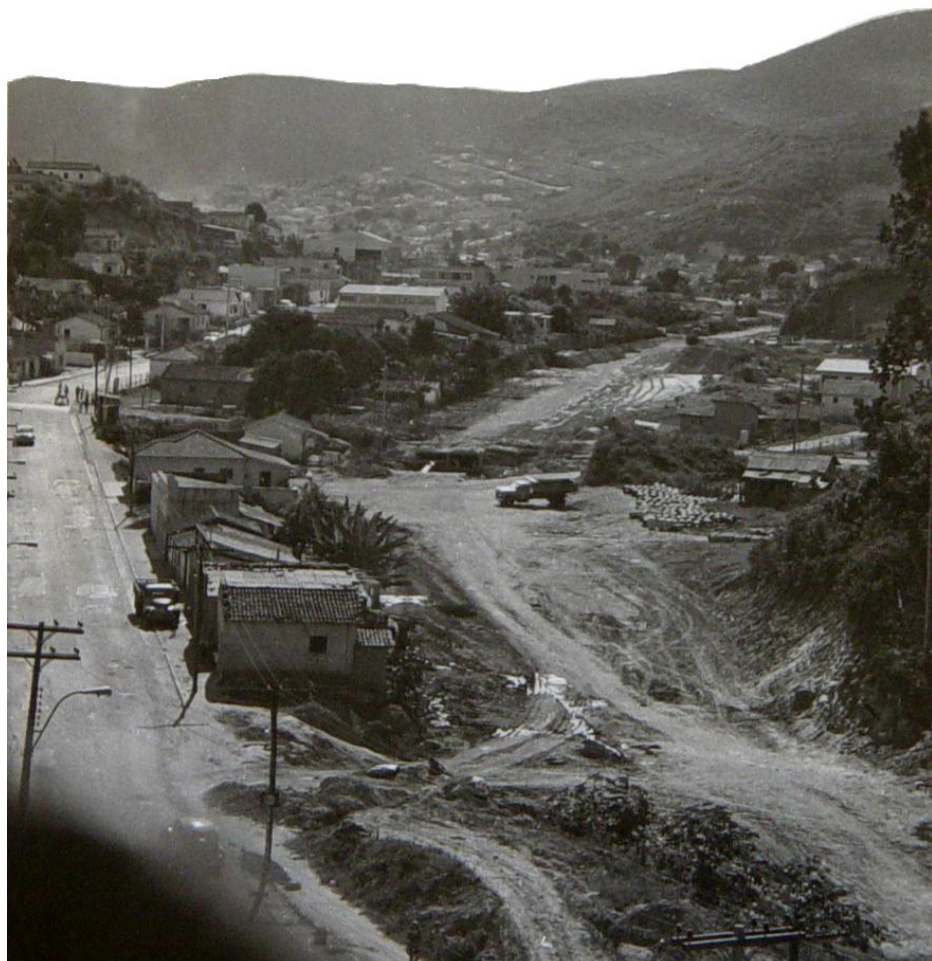
Encontro das avenidas Wilson Alvarenga e Getúlio Vargas no início da construção da cidade